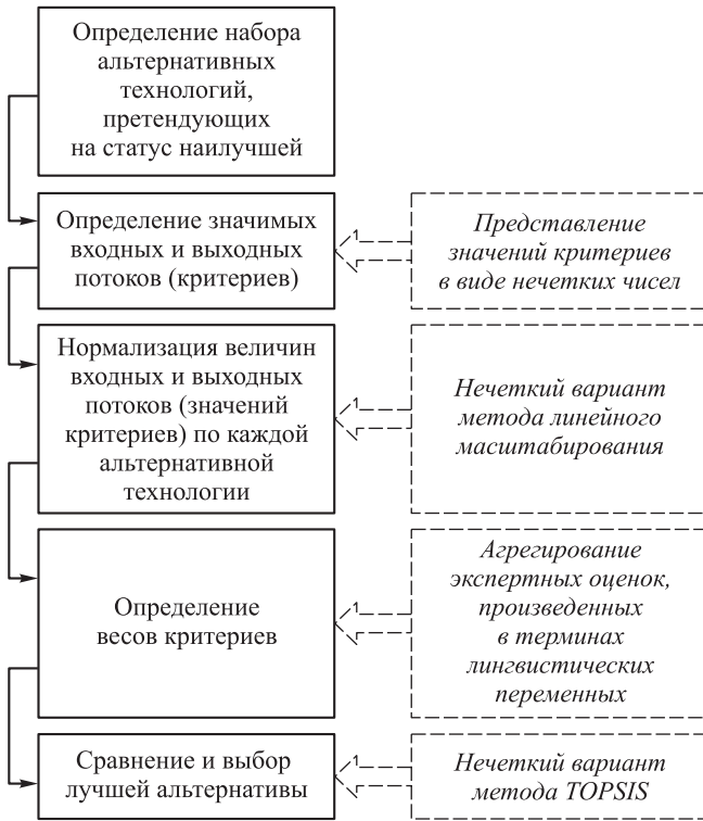
Рис. 1. Схема сравнения альтернативных технологий по уровням негативного воздействия на окружающую среду

Шаг 2. Оценки экспертов должны быть обобщены для того, чтобы получить единственную оценку \underline{r}_{ki} . Воспользуемся следующей простой процедурой агрегирования: