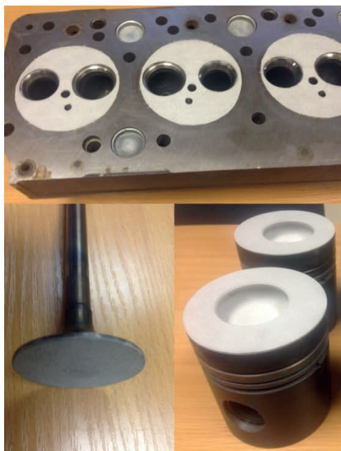
Рис. 1. Детали с напылением

Результаты испытаний базового двигателя и двигателя с частичной теплоизоляцией камеры сгорания приведены в табл. 1 и 2. Из таблиц (режим 4, см. табл. 1, и режим 12, см. табл. 2) следует, что применение теплоизоляции приводит к увеличению расхода топлива и повышению теплоотдачи в охлаждающую жидкость. Это можно объяснить более долгим испарением топлива за счет того, что при попадании топлива на поршень слой диоксида циркония охлаждается из-за низкого коэффициента проникновения теплоты, что ухудшает условия испарения. В то же время теплоотдача в смазочную систему снижается.